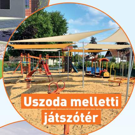
Uszoda melletti játszótér