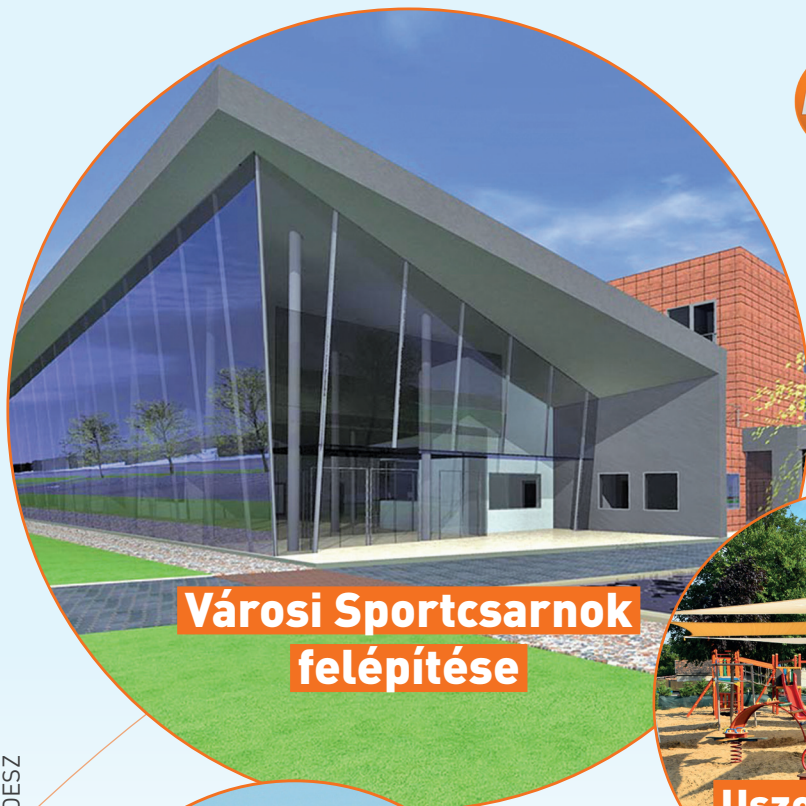
Városi Sportcsarnok felépítése