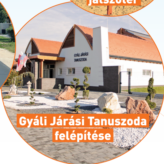
Gyáli Járási Tanuszoda felépítése